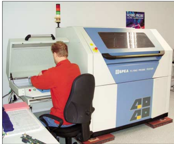
Bild 1: Der Flying-Probe-Tester Spea 4040 bei Testwerk in Hamburg